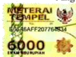
Nuruz Zahroh Desy Syifaun Nida