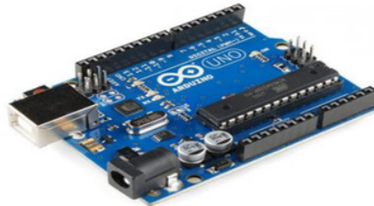
Gambar 1. Arduino Uno [5]

Arduino Uno adalah sebuah board mikrokontroler yang didasarkan pada Atmega328. Arduino Uno mempunyai 14 Input/output dengan 6 input PWM, 6 input analog, sebuah osilator kristal 16 Mhz, sebuah koneksi USB, sebuah power jack, sebuah ICSP header, dan sebuah tombol reset. Arduino Uno memuat semua yang dibutuhkan untuk menunjang mikrokontroler, mudah menghubungkan ke sebuah komputer dengan sebuah kabel USB dengan sebuah adaptor AC ke DC atau menggunakan baterai untuk memulainya.