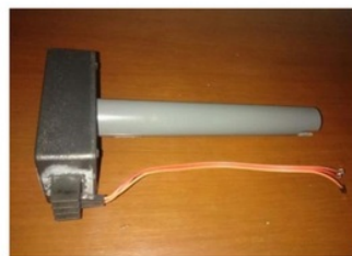
Gambar 2.2 Sensor Salinitas

Sensor Salinitas adalah suatu sensor yang dapat mengukur kadar garam dalam suatu kandungan zat yang terlarut pada air. Untuk perancangan sensor salinitas, dapat menggunakan prinsip konduktivitas yang ada pada dua probe dan di letakan pada suatu larutan yang diberikan beda potensial listrik (pada normalnya membentuk suatu sinusioda). Sebuah sistem konduktivitas tersusun atas dua elektrode yang dirangkaikan dengan sumber tegangan serta sebuah ampere meter. Elektrode-elektrode tersebut diatur sehingga memiliki jarak tertentu antara keduanya ( biasanya 1 cm). Pada saat pengukuran, kedua elektrode ini di celupkan ke dalam sampel larutan dan diberi tegangan dengan besar tertentu. Nilai arus listrik dibaca oleh ampere meter, digunakan lebih lanjut untuk menghitung nilai konduktivitas listrik larutan.