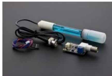
Gambar 2. sensor pH SKU SEN 0161[4]

Sensor pH adalah sensor yang digunakan untuk mengetahui derajat keasaman. Sensor pH yang digunakan dalam penelitian ini adalah SKU SEN 0161 dengan spesifikasi sebagai berikut :