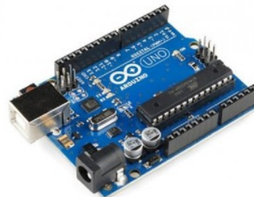
Gambar 1. Arduino Uno [4]

Arduino Uno adalah sebuah board mikrokontroler yang didasarkan pada Atmega328 . Arduino Uno mempunyai 14 Input/output dengan 6 input PWM, 6 input analog, sebuah osilator kristal 16 Mhz, sebuah koneksi USB, sebuah power jack , sebuah ICSP header, dan sebuah tombol reset. Arduino Uno memuat semua yang dibutuhkan untuk menunjang mikrokontroler, mudah menghubungkan ke sebuah komputer dengan sebuah kabel USB dengan sebuah adaptor AC ke DC atau menggunakan baterai untuk memulainya.