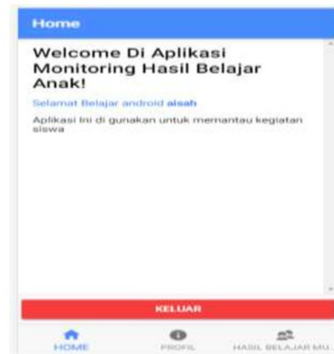
Gambar 3. Tampilan User

Aplikasi penelitian ini digunakan dan bangun dengan menggunakan bahas pemograman android yang menghasilkan aplikasi monitoring hasil belajar 18 k. Berikut ini adalah user interface pada halaman home dapat dilihat pada gambar 3.