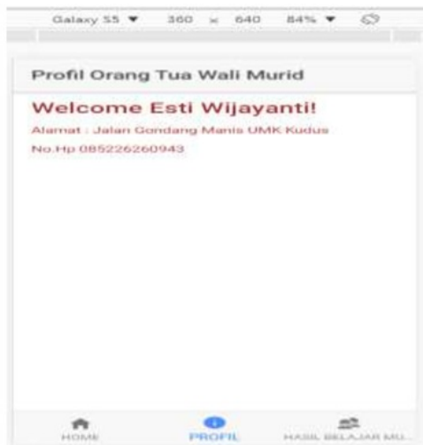
Gambar 4. Tampilan orang tua wali murid

Tampilan ini digunakan oleh orang tua siswa untuk memantau hasil belajar anak serta permasalahan dalam belajar siswa, misalkan siswa masih kurang memahami pelajaran matematika, ipa ataupun ips. Diharapkan orang tua mampu membimbing siswa, berikut ini, tampilan user orang tua wali siswa yang dapat dilihat pada gambar 5.