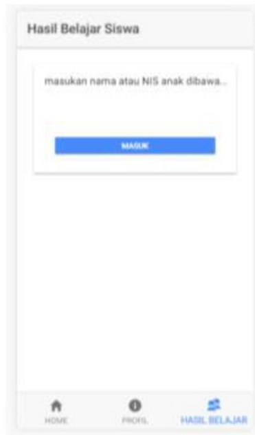
Gambar 4. Tampilan User orang tua

Tampilan ini digunakan oleh orang tua siswa untuk memantau hasil belajar anak serta permasalahan dalam belajar siswa, misalkan siswa masih kurang memahami pelajaran matematika, ipa ataupun ips. Diharapkan orang tua mampu membimbing siswa, berikut ini, tampilan user orang tua wali siswa yang dapat dilihat pada gambar 5.