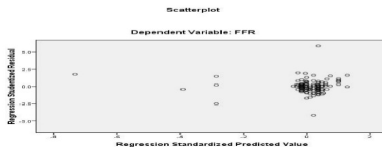
Gambar 1. Uji Heteroskedastisitas

Dari grafik di atas terlihat bahwa titik-titik menyebar secara acak maka dapat disimpulkan tidak terdapat heteroskedastisitas dalam model regresi penelitian ini.