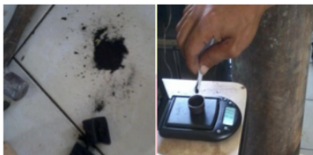
Gambar 2. Sampel biobriket yang akan diuji nilai kalor