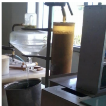
Gambar 3. Mengisi air di oval bucket

Oval bucket yang sudah terisi air dimasukkan dan ditunggu sekitar 4 menit hingga suhu yang ada di oval bucket dengan suhu di water jacket mencapai suhu sama (Gambar 4).