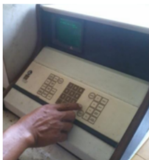
Gambar 5. Monitor yang menampilkan hasil pengujian