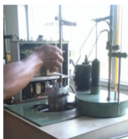
Gambar 4. Memasukkan oval bucket dan tabung reaktor

Oval bucket yang sudah terisi air dimasukkan dan ditunggu sekitar 4 menit hingga suhu yang ada di oval bucket dengan suhu di water jacket mencapai suhu sama (Gambar 4).