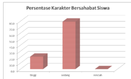
Gambar 2. Grafik Persentase Nilai N-Gain Angket Penanaman Karakter Bersahabat melalui Game Panjol

Secara grafik, perolehan N-Gain ternormalisasi dapat dilihat pada Gambar 2.