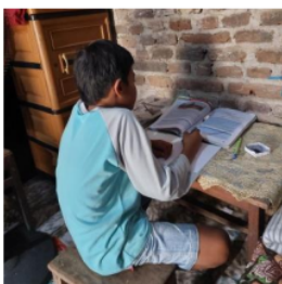
2 Gambar 10. Pembuatan Jadwal Belajar dan Catatan oleh MK 1

Berdasarkan hasil wawancara dan observasi yang diperoleh peneliti pada anak yang orang tuanya bekerja di pabrik garment yang berinisial MK 1 menunjukkan hasil bahwa ia memiliki jadwal pelajaran sekolah dan ditaruhnya dibuku tulis. MK 1 dalam melaksanakan jadwal belajar di rumah saat malam hari hanya saat ada tugas saja dari sekolah disisi lain orang tua dari MK 1 sudah memberikan jadwal belajar saat malam hari tetapi MK 1 tidak disiplin dalam melaksanakan jadwal belajar yang diberikan oleh orang tuanya tersebut. Selain jadwal belajar ada juga hal yang dilakukan oleh MK 1 yaitu mencatat materi yang terkadang diberikan oleh gurunya untuk meringkas materi pelajaran dari buku, MK 1 memiliki cara tersendiri dalam mencatat yaitu dengan membaca materi secara keseluruhan dan langsung memberikan garis bawah pada kalimat yang penting dan baru mencatat berdasarkan informasi penting yang diperolehnya.