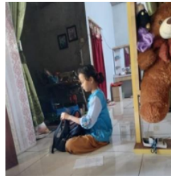
Gambar 3. Persiapan Belajar LS 2

2 Berdasarkan hasil wawancara dan observasi yang diperoleh peneliti pada anak yang orang tuanya bekerja di pabrik garment yang berinisial LS 2 menunjukkan hasil bahwa persiapan belajar yang dilakukan saat berada di kelas adalah dengan berdo'a terlebih dahulu sebelum pembelajaran dimulai. Sementara persiapan belajar yang dilakukan oleh LS 2 saat berada di rumah adalah dengan menyiapkan alat tulis saat malam hari sebelum berangkat sekolah pada esok harinya, hal tersebut selalu dilakukan oleh LS 2 agar peralatan sekolah yang ia butuhkan tidak ada yang ketinggalan di rumah.