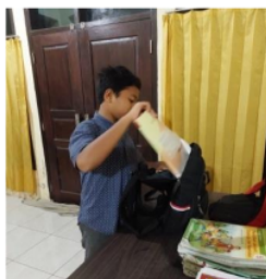
Gambar 1. Persiapan Belajar MA 1