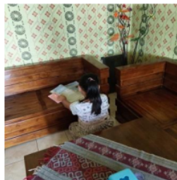
Gambar 12. Pembuatan Jadwal Belajar dan Catatan oleh A 2

Berdasarkan hasil wawancara dan observasi yang diperoleh peneliti pada anak yang orang tuanya bekerja di pabrik garment yang berinisial A 2 menyatakan bahwa ia memiliki jadwal pelajaran dari sekolah seperti informan yang lainnya. Jadwal tersebut ia catat dibuku tulis. Selain jadwal pelajaran di sekolah A 2 juga memiliki jadwal belajar di rumah saat malam hari dan terkadang juga waktu sepulang sekolah dengan jam rata-rata belajar 1 jam. selain pembuatan jadwal ada juga catatan yang perlu diperhatikan, dalam membuat catatan materi pelajaran A 2 memiliki caranya sendiri dalam meringkas materi yaitu dengan cara membaca materi terlebih dahulu dan dipahami lalu ia catat pada bagian informasi yang penting saja.