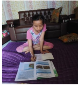
Gambar 11. Pembuatan Jadwal Belajar dan Catatan oleh LS 2

Berdasarkan hasil wawancara dan observasi yang diperoleh peneliti pada anak yang orang tuanya bekerja di pabrik garment yang berinisial LS 2 menunjukkan hasil bahwa ia memiliki jadwal pelajaran yang diperoleh dari sekolah dan jadwal tersebut dicatat dibuku tulis. Selain jadwal pelajaran dari sekolah LS 2 juga memiliki jadwal belajar di rumah yang terkadang ia tidak disiplin dalam melaksanakannya. LS 2 juga memiliki jadwal belajar di rumah yang terkadang ia tidak disiplin dalam melaksanakannya. LS 2 belajar jika ada tugas dari gurunya saja dan ia biasa melakukannya pada malam hari sehabis maghrib dengan waktu belajar kira-kira 1-2 jam. peran orang tua untuk LS 2 yang dilakukan adalah selalu mengingatkan anaknya untuk belajar walaupun sebentar. Selain jadwal belajar ada juga catatan, cara LS 2 dalam meringkas materi ialah dengan membaca materinya terlebih dahulu lalu ia pahami dan mencatat informasi penting yang diperoleh dari hasil membacanya.