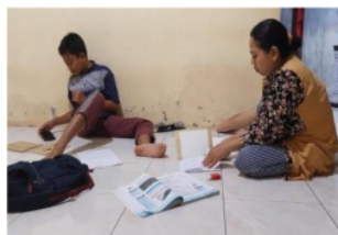
2 Gambar 13. MA 1 Mengerjakan Tugas Dibimbing Orang Tua

Berdasarkan hasil wawancara dan observasi yang diperoleh peneliti pada anak yang orang tuanya bekerja di pabrik garment yang berinisial MA 1 menunjukkan hasil bahwa ia mengerjakan sendiri tugas rumah yang diberikan oleh guru sesuai dengan kemampuannya yang dimilikinya. MA 1 mengerjakan tugas yang diberikan oleh gurunya di rumah terkadang jika ia mengalami kesulitan dalam mengerjakan tugasnya ia bertanya orang tuanya dan jika orang tuanya tidak bisa mendampingi belajar saat di rumah karena sibuk bekerja hingga pulang sampai malam ia lebih suka memilih mencontek kepada temannya.