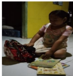
Gambar 4. Persiapan Belajar A 2

2 Berdasarkan hasil wawancara dan observasi yang diperoleh peneliti pada anak yang orang tuanya bekerja di pabrik garment yang berinisial A 2 menunjukkan hasil bahwa persiapan belajar yang