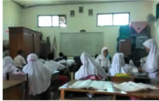
Gambar 7. Cara LS 2 Mengikuti Pelajaran

2 Berdasarkan hasil wawancara dan observasi yang diperoleh peneliti pada anak yang orang tuanya bekerja di pabrik garment yang berinisial LS 2 menunjukkan hasil bahwa sebelum pembelajaran di kelas dimulai LS 2 tidak selalu untuk membaca materi pelajaran yang akan dipelajari nantinya. Dalam hal mencatat materi pelajaran LS 2 selalu mencatat apa yang gurunya tulis dipapan tulis untuk disalin dibukunya agar bisa digunakan untuk belajar di rumah, tetapi terkadang LS 2 malas untuk mencatatnya. Disisi lain LS 2 memiliki caranya sendiri dalam memahami materi pelajaran saat guru menerangkan dengan cara mendengarkan dan memperhatikan guru.