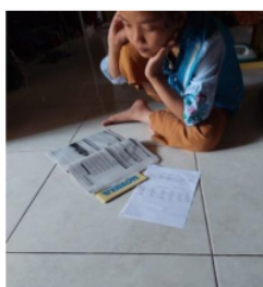
Gambar 15. LS 2 Mengerjakan Tugas Mandiri