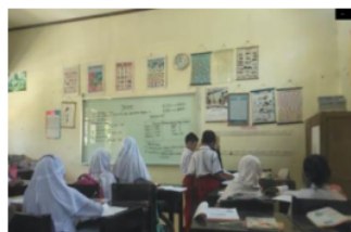
Gambar 5. Cara MA 1 Mengikuti Pelajaran

Berdasarkan hasil wawancara dan observasi yang diperoleh peneliti pada anak yang orang tuanya bekerja di pabrik garment yang berinisial MA 1 menunjukkan hasil bahwa sebelum pembelajaran dimulai MA 1 tidak selalu membaca materi terlebih dahulu dan ia akan membacanya jika disuruh oleh guru saja. Dalam hal mencatat materi pelajaran MA 1 tidak selalu mencatat karena malas tetapi saat pembelajaran di kelas berlangsung MA 1 selalu memperhatikan guru saat menerangkan materi pelajaran dan bertanya ketika ia tidak paham dengan materi yang dipelajarinya.