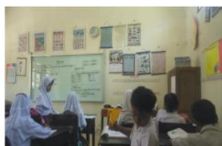
Gambar 6. Cara MK 1 Mengikuti Pelajaran

Berdasarkan hasil wawancara dan observasi yang diperoleh peneliti pada anak yang orang tuanya bekerja di pabrik garment yang berinisial MK 1 menunjukkan hasil bahwa ketika pembelajaran akan dimulai ia tidak membaca materi pelajaran terlebih dahulu tetapi saat pembelajaran sedang berlangsung agar ia memahami materi yang disampaikan oleh gurunya ia selalu mendengarkan, memperhatikan dan bertanya kepada guru jika ada materi yang belum dipahami. Jika guru mencatat materi di papan tulis MK 1 selalu mencatat materi dan disalin dibuku tulis untuk belajar di rumah.