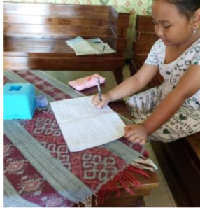
2 Gambar 16. A 2 Mengerjakan Tugas Mandiri

Berdasarkan hasil wawancara dan observasi yang diperoleh peneliti pada anak yang orang tuanya bekerja di pabrik garment yang berinisial A 2 menunjukkan hasil bahwa saat mengerjakan tugas di rumah A 2 selalu mengerjakan tugas sendiri sesuai dengan kemampuannya dan jika A 2 mengalami kesulitan dalam mengerjakan tugas ia akan bertanya kepada kakaknya dan terkadang A 2 juga lebih memilih untuk mencari jawaban dari internet karena lebih cepat.