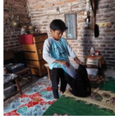
Gambar 2. Persiapan Belajar MK 1

2 Berdasarkan hasil wawancara dan observasi yang diperoleh peneliti pada anak yang orang tuanya bekerja di pabrik garment yang berinisial MK 1 menunjukkan hasil bahwa persiapan belajar yang biasa dilakukan di kelas adalah selalu berdo'a sebelum pembelajaran dimulai, selain itu juga persiapan belajar dilakukan oleh MK 1 saat di rumah adalah dengan menyiapkan buku tulis dan peralatan sekolah lainnya. Persiapan yang biasa dilakukan oleh MK 1 ialah saat malam hari.