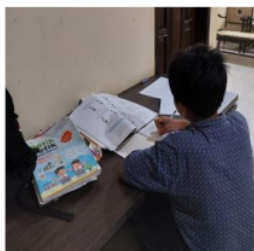
2 Gambar 9. Pembuatan Jadwal Belajar dan Catatan oleh MA 1

Berdasarkan hasil wawancara dan observasi yang diperoleh peneliti pada anak yang orang tuanya bekerja di pabrik garment yang berinisial MA 1 menunjukkan hasil bahwa ia memiliki jadwal pelajaran yang ditentukan oleh sekolah dan selalu diletakkan di meja belajar supaya mudah saat ia melakukan persiapan belajar untuk esok hari. MA 1 tidak selalu memiliki jadwal belajar saat malam hari karena ia hanya akan belajar saat ada PR dari sekolah apalagi orang tuanya yang terkadang kerja lembur sampai malam sehingga tidak bisa mengingatkan anaknya untuk belajar. Disamping jadwal belajar yang tidak teratur MA 1 dapat mencatat atau meringkas materi yang biasa guru tugaskan di rumah, hal tersebut diharapkan dapat membantu anak agar rajin membaca materi pelajaran. Dalam mencatat materi cara MA 1 adalah dengan membaca keseluruhan materi terlebih dahulu lalu ia cari informasi yang penting dan mencatatnya dengan menggunakan kalimatnya sendiri.