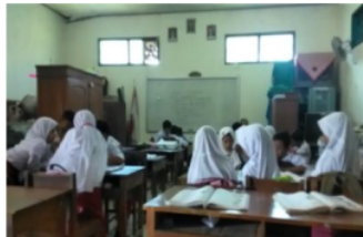
Gambar 8. Cara A 2 Mengikuti Pelajaran

Berdasarkan hasil wawancara dan observasi yang diperoleh peneliti pada anak yang orang tuanya bekerja di pabrik garment yang berinisial A 2 menyatakan bahwa sebelum pembelajaran dimulai ia akan membaca materi pelajaran yang akan dipelajari jika disuruh oleh gurunya saja. Dalam hal mencatat materi pelajaran A 2 tidak selalu mencatat materi karena ia hanya kadang-kadang saja saat mencatat materi yang disampaikan oleh guru. Selain itu juga, dalam pemahaman materi yang dilakukan oleh A 2 saat pembelajaran berlangsung ia memperhatikan guru saat menerangkan materi pelajaran.