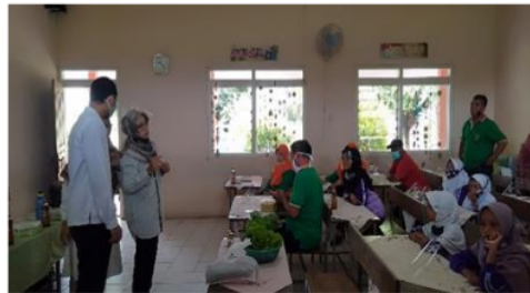
Gambar 1. Peserta bertanya saat pendampingan

Dalam presentasi tersebut tim pengabdian menjelaskan terdapat berbagai macam media pembelajaran berbasis konservatif diantaranya media pembelajaran dengan media hidroponik. Keuntungan dalam menggunakan media pembelajaran dengan media hidroponik yaitu dapat mengajarkan siswa berbagai hal seperti mencintai lingkungan, dapat mengetahui berbagai jenis tanaman, dapat mengetahui konsep bercocok tanam, dan lain-lain sehingga dapat mendorong antusiasme dari peserta untuk menciptakan media pembelajaran hidroponik dengan media yang lebih reliable. Pada proses pendampingan peserta terlihat sangat antusias dengan bertanya kepada tim pengabdian selama pendampingan.