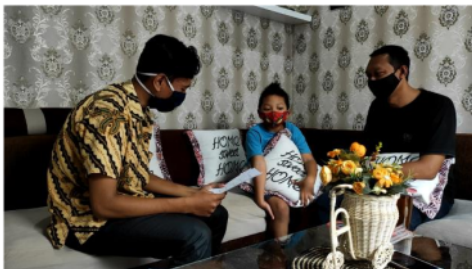
Gambar 1. Wawancara dengan siswa I

Peneliti melakukan wawancara kepada beberapa siswa SD 2 Tengeles baik secara langsung dan melalui video call .