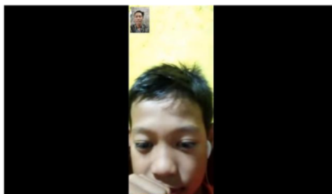
Gambar 2. Wawancara dengan Siswa II

Dari sini peneliti menganalisa bahwa perbandingan anatar melihat atau menyimak materi pelajaran yang dilakukan secara langsung dengan tidak langsung lebih dipahami oleh siswa jika dilakukan secara langsung atau secara tatap muka. Dengan interaksi secara langsung siswa akan lebih faham dan mengerti tentang materi yang diterangkan.