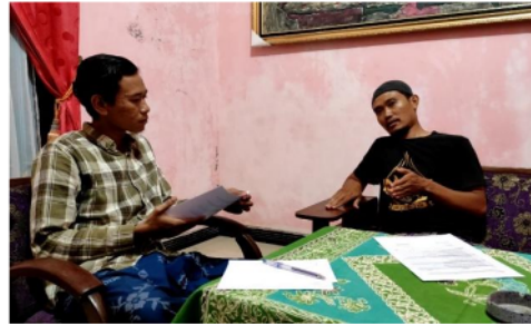
Gambar 3. Wawancara dengan Guru I

Wawancara yang pertama adalah dengan Bapak KH guru kelas VI SD 2 Tenggeles. yang peneliti lakukan secara langsung. Berdasarkan hasil wawancara yang peneliti lakukan kepada guru SD 2 Tenggeles adalah pada masa pandemi covid-19 mempengaruhi proses pembelajaran guru karena tidak bisa bertemu dan mengajar secara langsung dengan siswa, jadi terjadi kesulitan dalam memberikan materi pelajaran kepada siswa, pembelajaran di sekolah menjadi terganggu dan menjadi tidak efektif dan kurang maksimal, dimana yang sebelumnya dalam satu hari bisa selesai satu pembelajaran kini menjadi terpankas. Dalam data yang ditemukan informan mengemukakan bahwa: