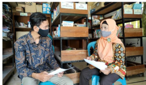
Gambar 4. Wawancara dengan Guru II

Wawancara dengan guru selanjutnya adalah dengan Ibu AS Guru kelas IV yang peneliti lakukan secara langsung di SD 2 Tenggeles.