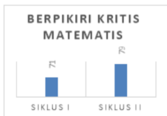
Gambar 1 Diagram Kemampuan Berpikir Kritis Matematis Siswa

Pada Gambar 1, kemampuan berpikir kritis matematis siswa meningkat dengan rata-rata skor 71 dalam kategori cukup untuk Siklus I dan 79 dalam kategori baik untuk Siklus II.