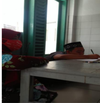
Gambar 3. AD sedang belajar.

Peneliti : apa yang membuat kamu semangat belajar dalam mengerjakan tugas di rumah ? AD : biar bisa jadi polisi. (Wawancara 6/04/2021).