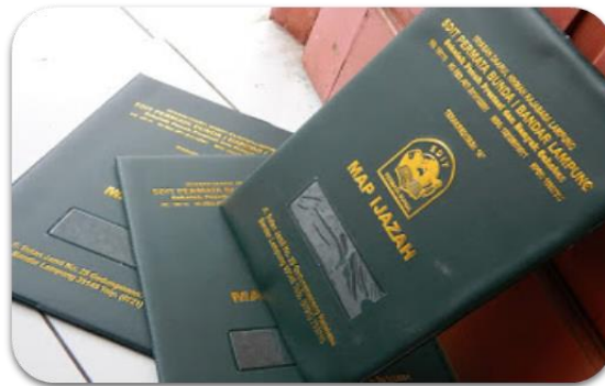
Gambar 4. Produk sampul ijazah

Beberapa cara dalam memproduksi barang yang kreatif dan inovasi, Kotler 2015: (1) atribut produk baru yang dikembangkan, (2) beragam tingkat mutu yang ditingkatkan, (3) model dan ukuran produk yang dikembangkan. Gambar dibawah ini merupakan peningkatan mutu dari produk yang sebelumnya dengan menggunakan mesin press hidrolis.