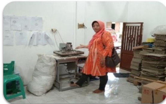
Gambar 1. Pendampingan usaha membuat produk sampul ijazah