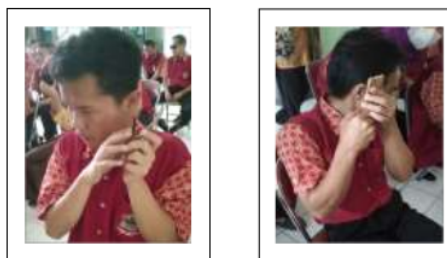
Gambar 2. Dokumen Foto Aktivitas Penerima Manfaat Sensorik Netra dalam Mengoperasikan Smartphone Melalui Aplikasi Talkback dalam Mencari Informasi dan Pengetahuan

Faktor navigasi smartphone menggunakan aplikasi Talkback dalam mencari informasi secara audio dengan beberapa sentuhan ganda pada layar smartphone . Kapabilitas persepsi dan visi terhadap intuisi estetis perabaan dan pendengaran memiliki peningkatan pengetahuan diri melalui ekspresi emosi penerima manfaat disabilitas sensorik netra (Valente, Theurel, & Gentaz, 2017). Berdasarkan observasi yang diamati dalam kehidupan sehari-hari, aktivitas mendengarkan notifikasi smartphone yang digunakan dengan menggunakan kecepatan jari tangan untuk mengoperasikan perintah dan memberikan tanggapan secara spontan berupa lisan. Kebiasaan aktivitas tersebut dipengaruhi oleh seberapa lama menggunakan dan lamanya mengoperasikan aplikasi di dalam smartphone tersebut.