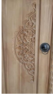
Gambar 3. Pola Gambar Bunga II

Gebyok ukir Jepara sangat cocok untuk dijadikan pintu rumah ataupun pintu masjid sehingga semakin membuat rumah semakin menarik dan unik (Muhajirin, 2018, p. 64).