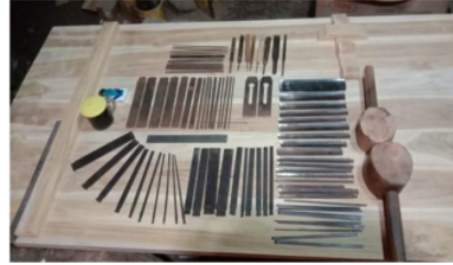
Gambar 5. Alat Tatah

Dalam seni gebyok nilai estetika terdapat pada pola gambar dan alat yang digunakan pada karya seni gebyok, untuk pola gambar dalam gebyok di desa Blimbing Rejo Jepara memiliki macam-macam pola gambar, pola gambar yang dibuat oleh pengrajin gebyok di desa Blimbing Rejo adalah gambar bunga, wayang, dan hewan, yang biasanya terdapat pada perlengkapan mebel seperti kursi, meja, pintu dan lain-lain. Alat-alat yang digunakan-pun sangat unik mereka menyebutnya dengan alat tatah, berikut ini alat yang digunakan para pengrajin gebyok di Desa Blimbing Rejo sebagai berikut.