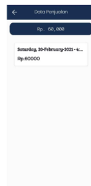
Gambar 4.3 Tampilan Data Penjualan

Pada tampilan diatas merupakan hasil dari data penitipan barang ke angkringan oleh admin.