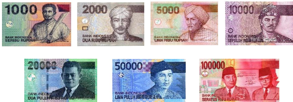
Gambar 1. Desain Marker

Marker yang digunakan adalah uang kertas Indonesia tahun 2014 tampak depan yang telah melalui proses cropping atau pemotongan dengan aplikasi Adobe Photoshop CS6 . Mulai dari uang seribu rupiah, dua ribu rupiah, lima ribu rupiah, sepuluh ribu rupiah, dua puluh ribu rupiah, lima puluh ribu rupiah, sampai seratus ribu rupiah. Pada gambar 4.1 terlihat marker yang telah melalui proses cropping atau pemotongan dengan aplikasi Adobe Photoshop CS6 . Cara kerjanya yaitu hanya perlu menyoroti gambar pahlawan pada uang kertas yang masing-masing dimiliki. Bukan keseluruhan tampak depan uang kertas tersebut namun hanya gambar pahlawan saja, seperti yang nampak pada gambar 3.1. Disini marker didaftarkan di web vuforia selanjutnya akan di import ke Unity3D . Dengan marker yang mudah dan hampir semua orang memilikinya baik dari golongan bawah sampai golongan atas, maka tidak sulit aplikasi ini akan diterima oleh masyarakat luas karena akan terasa lebih mudah untuk menggunakannya.