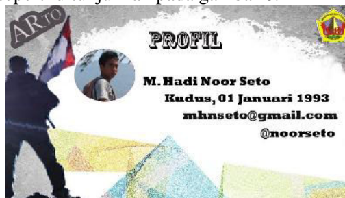
Gambar 8. Profil Pengembang Aplikasi

Selanjutnya yang terakhir adalah tampilan Profil, disini menampilkan informasi tentang biodata pengembang aplikasi, seperti ditunjukkan pada gambar 8.