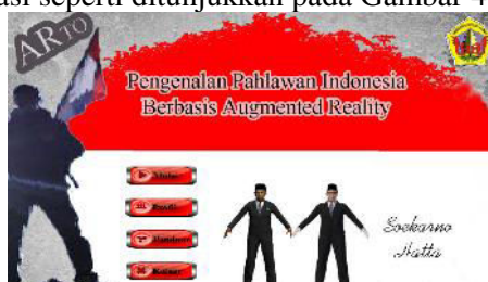
Gambar 4. Halaman Utama Aplikasi ARTO

Pada tampilan selanjutnya user akan dihadapkan pada menu halaman utama, dimana disini terdapat menu-menu utama aplikasi seperti ditunjukkan pada Gambar 4.