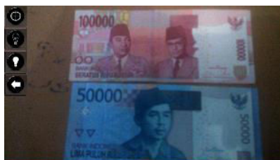
Gambar 5. Tampilan Marker Kurang Jelas dan Kurang Penerangan

Ketika user menekan tombol Mulai maka user akan dihadapkan pada tampilan capture marker . Disini user harus mengarahkan kamera ke depan marker yaitu tampak depan uang kertas sesuai nominal yang dimiliki. Di dalam tampilan capture marker (gambar 5) sudah ada tombol Auto Focus yang berguna jika objek tidak nampak karena marker kurang jelas, led on berfungsi ketika suasana gelap dan led off berfungsi untuk mematikan penerangan (gambar 5). Marker yang digunakan bersifat multimarker, jadi user langsung dapat mengganti-ganti marker tersebut (gambar 6).