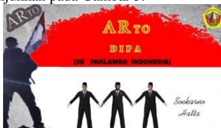
Gambar 3. Splash Screen

Setelah user membuka aplikasi, maka user selanjutnya akan dihadapkan pada tampilan splash screen aplikasi seperti ditunjukkan pada Gambar 3.