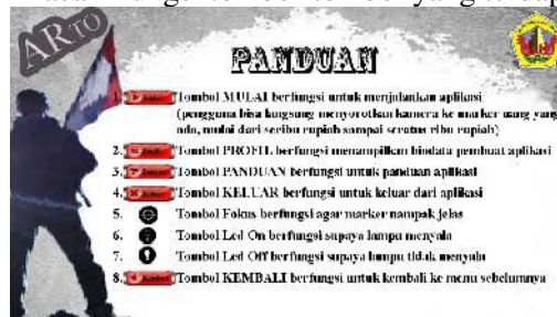
Gambar 7. Panduan Aplikasi ARTO

Pada menu panduan berisi tentang penjelasan atau panduan dari aplikasi, dimana didalamnya dijelaskan berbagai macam fungsi tombol-tombol yang terdapat pada aplikasi