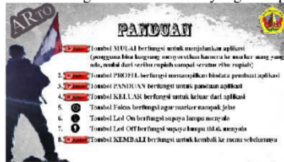
Gambar 7. Panduan Aplikasi ARTO

Pada menu panduan berisi tentang penjelasan atau panduan dari aplikasi, dimana didalamnya dijelaskan berbagai macam fungsi tombol-tombol yang terdapat pada aplikasi