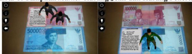
Gambar 6. Multimarker

Pada gambar 6 adalah tampilan multimarker sudah menggunakan fungsi tombol Auto Focus agar gambar yang sebelumnya buram menjadi fokus dan lebih terang karena sudah menggunakan fungsi tombol Led On . Multimarker yang dimaksud adalah pengguna dapat langsung menyorotkan marker mulai dari seribu rupiah sampai seratus ribu rupiah secara langsung