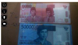
Gambar 5. Tampilan Marker Kurang Jelas dan Kurang Penerangan

Ketika user menekan tombol Mulai maka user akan dihadapkan pada tampilan capture marker . Disini user harus mengarahkan kamera ke depan marker yaitu tampak depan uang kertas sesuai nominal yang dimiliki. Di dalam tampilan capture marker (gambar 5) sudah ada tombol Auto Focus yang berguna jika objek tidak nampak karena marker kurang jelas, led on berfungsi ketika suasana gelap dan led off berfungsi untuk mematikan penerangan (gambar 5). Marker yang digunakan bersifat multimarker, jadi user langsung dapat mengganti-ganti marker tersebut (gambar 6).