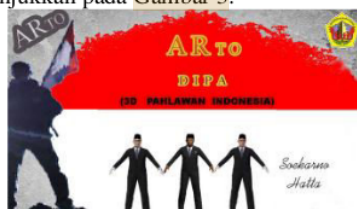
Gambar 3. Splash Screen

Setelah user membuka aplikasi, maka user selanjutnya akan dihadapkan pada tampilan splash screen aplikasi seperti ditunjukkan pada Gambar 3.