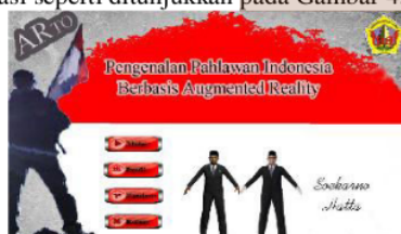
Gambar 4. Halaman Utama Aplikasi ARTO

Pada tampilan selanjutnya user akan dihadapkan pada menu halaman utama, dimana disini terdapat menu-menu utama aplikasi seperti ditunjukkan pada Gambar 4.