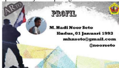
Gambar 8. Profil Pengembang Aplikasi

Selanjutnya yang terakhir adalah tampilan Profil, disini menampilkan informasi tentang biodata pengembang aplikasi, seperti ditunjukkan pada gambar 8.