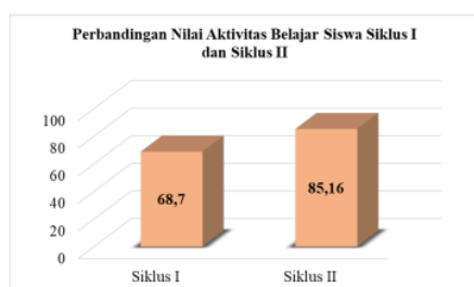
Gambar 3. Perbandingan Nilai Rata-rata Maksimum Aktivitas Belajar Siswa

Hasil observasi aktivitas belajar siswa pada siklus I memperoleh nilai rata-rata maksimum 68,7 dengan kriteria cukup dan mengalami peningkatan pada siklus II yang memperoleh nilai rata-rata maksimum 85,16 dengan kriteria baik. Untuk memperjelas perbandingan hasil pengamatan aktivitas belajar siswa pada siklus I dan II dapat dilihat pada Gambar 3 berikut ini.