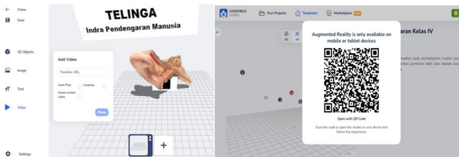
Gambar 1. Media Pembelajaran 3D Materi Indera Pendengaran Manusia Dengan Augmented Reality Assembler Edu

Bahan dan alat yang digunakan dalam pembuatan media pembelajaran 3D materi indera pendengaran manusia dengan Augmented Reality Assembler Edu adalah komputer/laptop dengan memanfaatkan software Assembler Edu, Youtube, Peramban Chrome/Mozilla/Google dan pembaca barcode. Langkah pengembangan media adalah, (1)membuat proyek di aplikasi Assembler Edu, (2)merekam narasi penjelasan materi indera pendengaran manusia, (3)mengupload rekaman narasi penjelasan materi ke Youtube, (4)menyisipkan narasi penjelasan tersebut ke dalam proyek, (6)menyimpan proyek dan membagikan barcode dan (7)membagikan barcode melalui bluetooth/whatsapp atau cetakan di kertas.