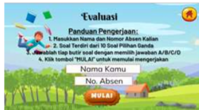
Gambar 8. Tampilan Evaluasi

Tampilan menu pada evaluasi, dengan tampilan awal harus menuliskan identitas nama siswa, selanjutnya akan masuk ke soal-soal pilihan ganda dengan latihan soal terkait materi siklus air.