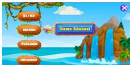
Gambar 2. Tampilan Menu

Pada tampilan menu terdapat pilihan menu yang menampilkan beberapa bagian isi yang meliputi menu KI/KD, menu materi, menu evaluasi yang berisi latihan soal-soal, menu informasi terkait pengembang media dan daftar pustaka, dan menu game edukasi yang berisi permainan yang berkaitan dengan materi.