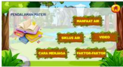
Gambar 6. Tampilan Materi

Tampilan menu materi terdapat video yang berfungsi untuk menjelaskan materi secara utuh terdapat gambar, animasi, suara agar siswa dapat mendengarkan materi secara lengkap.