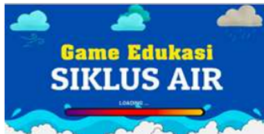
Gambar 1. Tampilan Loading

Tampilan awal screen akan muncul pertama kali saat membuka aplikasi di HP Android, ketika muncul tidak akan masuk kedalam menu media game edukasi akan tetapi akan proses loading.