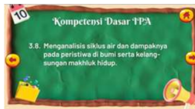
Gambar 4. Tampilan KD IPA