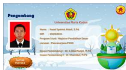
Gambar 12. Tampilan Informasi

Tampilan pada menu informasi berisikan tentang identitas pengembang media interaktif game edukasi yang diciptakan oleh peneliti. Serta berisikan daftar pustaka yang dipakai oleh peneliti untuk mengisi materi yang terdapat pada media interaktif game edukasi tersebut.