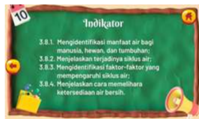
Gambar 5. Tampilan Indikator

Tampilan menu materi bila di klik akan menuju kelayar materi pembelajaran tentang siklus air. Terdapat vidio, gambar, animasi, serta suara yang menjelaskan materi tersebut. Pada menu materi akan muncul menu manfaat air, siklus air, vidio, cara menjaga siklus air dan faktor-faktor yang mempengaruhi siklus air.