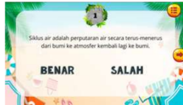
Gambar 10. Permainan Banar/Salah