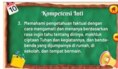
Gambar 3. Tampilan KI

Pada tampilan menu KI/KD setelah di klik akan muncul ke layar dan terdapat suara yang menjelaskan materi pembelajaran tematik khususnya materi IPA di kelas 5 Tema 8 "Lingkungan Sahabat Kita". Pada KD IPA yaitu 3.8 tentang menganalisis siklus air dan dampaknya pada peristiwa di bumi serta kelangsungan makhluk hidup. Indikator yang hendak dicapai yaitu mengidentifikasi manfaat air bagi manusia, hewan, dan tumbuhan; menjelaskan terjadinya siklus air; mengidentifikasi faktor-faktor yang mempengaruhi siklus air; dan menjelaskan cara memelihara ketersediaan air bersih.