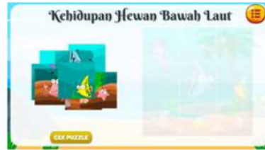
Gambar 9. Permainan Puzzle

sebuah bagan siklus air dengan urutan yang tepat dan menempelkan jawaban sesuai dengan bagan proses siklus air.