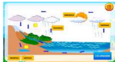
Gambar 11. Permainan Pick One

Tampilan pada menu informasi berisikan tentang identitas pengembang media interaktif game edukasi yang diciptakan oleh peneliti. Serta berisikan daftar pustaka yang dipakai oleh peneliti untuk mengisi materi yang terdapat pada media interaktif game edukasi tersebut.