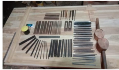
Gambar 5. Alat Tatah

Dalam seni gebyok nilai estetika terdapat pada pola gambar dan alat yang digunakan pada karya seni gebyok, untuk pola gambar dalam gebyok di desa Blimbing Rejo Jepara memiliki macam-macam pola gambar, pola gambar yang dibuat oleh pengrajin gebyok di desa Blimbing Rejo adalah gambar bunga, wayang, dan hewan, yang biasanya terdapat pada perlengkapan mebel seperti kursi, meja, pintu dan lain-lain. Alat-alat yang digunakan-pun sangat unik mereka menyebutnya dengan alat tatah, berikut ini alat yang digunakan para pengrajin gebyok di Desa Blimbing Rejo sebagai berikut.