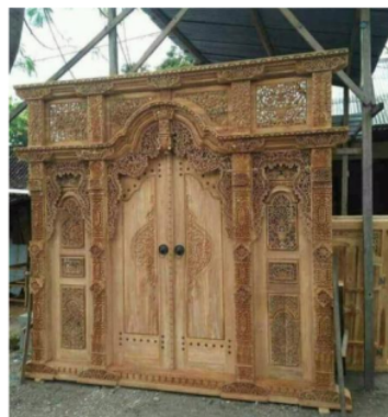
Gambar 2. Pola Gambar Bunga I

Nilai apresiasi yang di persepsikan dalam mengapresiasi seni gebyok adalah estetika atau keindahan, Estetika yaitu bagian dari filsafat yang mengkaji dan mengkaji keahlian, keindahan, dan reaksi manusia terhadapnya, gaya dikenal memiliki dua metodologi. Pertama-tama, analisis objek, objek, alam yang indah, dan mahakarya dengan lugas. Kedua, menampilkan apa yang terjadi pada pemeriksaan kecenderungan menyenangkan yang mampu dilakukan oleh subjek, yang kemudian memunculkan pertemuan yang penuh selera. Masalah gaya ini kemudian, pada saat itu, memunculkan implikasi yang sangat berbeda, dalam arti memiliki banyak sudut pandang pendekatan, sehingga masalah selera bergantung pada keadaan, kondisi, dan posisi di mana mereka ditemukan (maruto joko, 2014, p. 26).