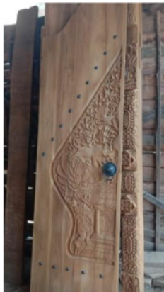
Gambar 4. Pola Gambar Wayang

2 Gebyok ukir Jepara sangat cocok untuk dijadikan pintu rumah ataupun pintu masjid sehingga semakin membuat rumah semakin menarik dan unik (Muhajirin, 2018, p. 64).