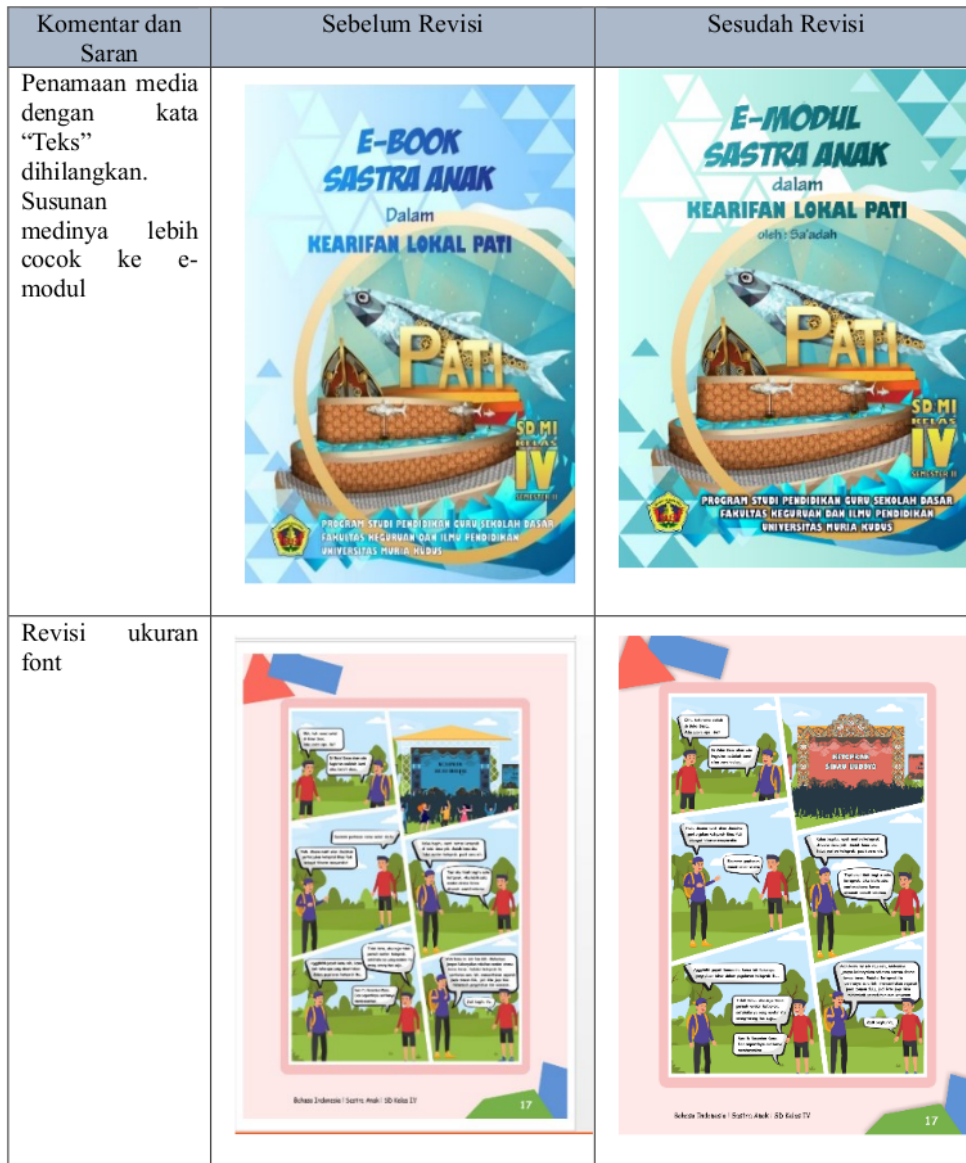
Tabel 7. Revisi Desain Media Pembelajaran E-Modul