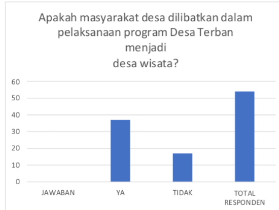
Gambar 2. Jawaban Responden 2.

Dari Tabel 2 dan Gambar 2 menunjukkan mayoritas responden mengetahui bahwa masyarakat desa dilibatkan dalam pelaksanaan program Desa Terban menjadi desa wisata dengan menjawab Ya sebanyak 37 responden dan yang menjawab Tidak sebanyak 17 dari total sebanyak 54 responden. Jawaban ini menunjukkan bahwa pelibatan masyarakat Desa Terban dalam pelaksanaan program desa wisata merupakan aspek penting sebagai bukti dukungan masyarakat untuk kesuksesan program tersebut.