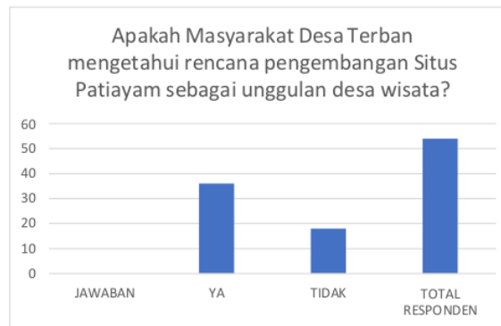
Gambar 1. Jawaban Responden 1.

Dari Tabel 1 dan Gambar 1 diketahui bahwa responden mayoritas menjawab Ya dengan jumlah 36 dan yang menjawab Tidak berjumlah 18 dari total responden berjumlah 54. Hal ini menunjukkan bahwa mayoritas responden sudah mengetahui rencana pengembangan situs Patiayam sebagai unggulan desa wisata. Hal ini merupakan sinyal positif bagi pemerintah untuk mengembangkan sektor wisata prasejarah di kawasan ini.