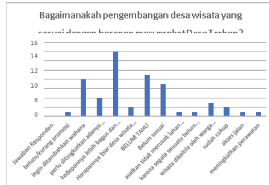
Gambar 3. Jawaban Responden 3

Dari Tabel 3 dan Gambar 3 diketahui bahwa mayoritas responden menjawab ke depannya lebih bagus dan maju lagi terkait dengan pengembangan desa wisata di Desa Terban. Berdasarkan jawaban tersebut di atas, dapat kita ketahui bahwa besar harapan mereka terhadap program ini dengan memberi banyak masukan agar pengembangan desa wisata dapat segera terlaksana. Masyarakat juga berharap dengan program ini akan meningkatkan taraf kesejahteraan ekonomi dengan peluang usaha yang muncul dari adanya wisata Situs Patiayam. Meskipun demikian, ada juga kekhawatiran terjadi kerusakan lahan pertanian akibat pembangunan infrastruktur seperti jalan dan pengembangan lokasi situs.