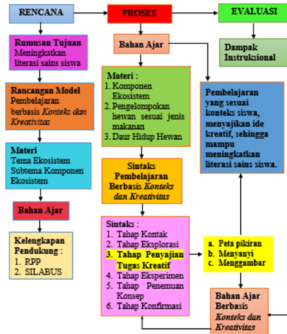
Gambar 2. Disain Bahan Ajar

Tujuan yang akan dicapai dalam pengembangan bahan ajar ini adalah meningkatkan literasi sains siswa dengan rancangan model pembelajaran berbasis Konteks dan Kreativitas . Materi yang dipilih dalam pengembangan bahan ajar ini adalah materi pada tema ekosistem subtema komponen ekosistem. Rencana pengembangan ini dilakukan dengan maksud menghasilkan bahan ajar disertai kelengkapan pendukung yang berupa rencana pelaksanaan pembelajaran dan silabus.