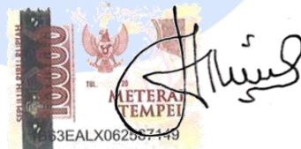
WAHYU AJI SUTRISNO