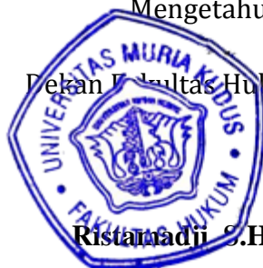
Ristandadi S.H, MH